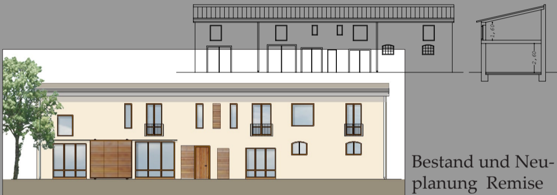
Bestand und Neuplanung Remise