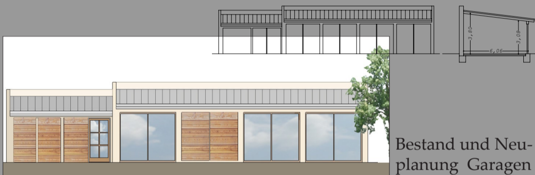
Bestand und Neuplanung Garagen